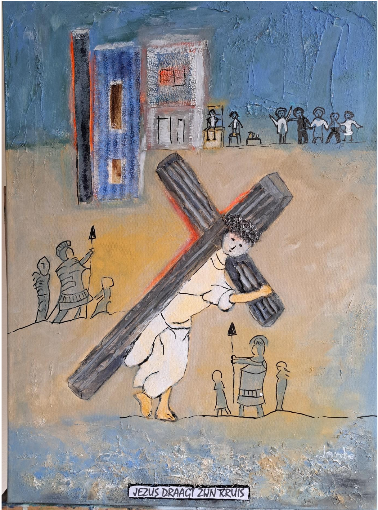
JEZUS DRAAGT ZIJN KRUIS