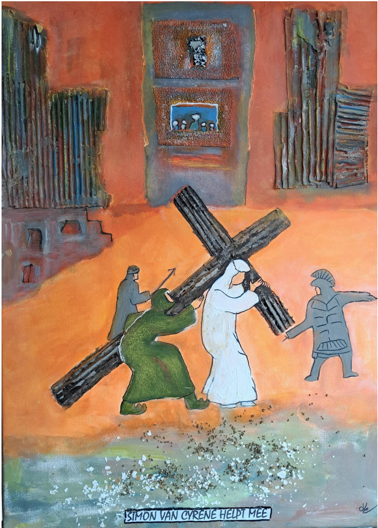
SIMON VAN CYRENE HELPT MEE