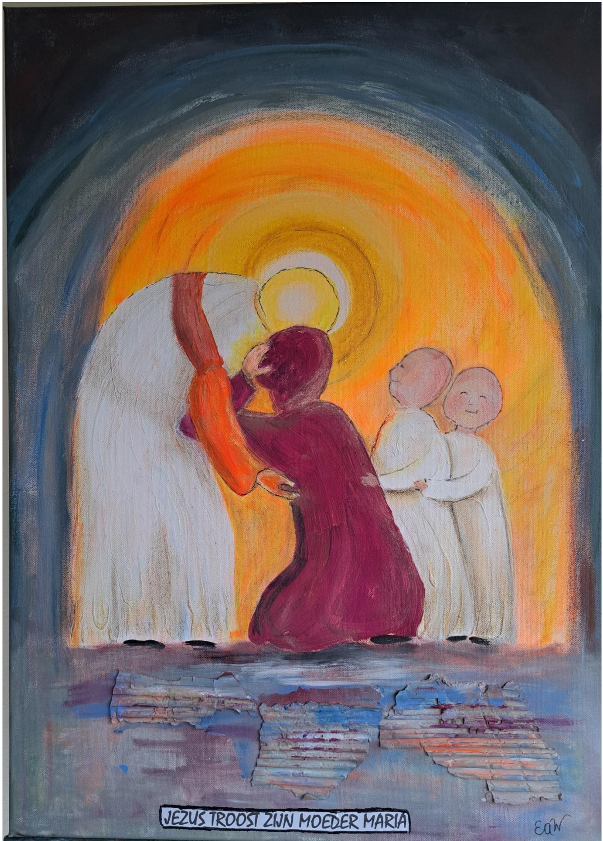
JEZUS TROOST ZIJN MOEDER MARIA